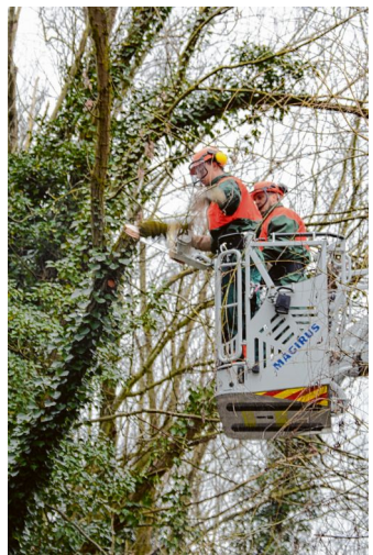
Vom Korb der Drehleiter aus zerlegen Mitglieder der Freiwilligen Feuerwehr Wentorf die morschen Bäume.

Privat mag die Körperpsychotherapeutin es auch gerne laut: Sie singt nebenbei in ihrer ehemaligen Schulband „Holy Moses“ von Wacken bis auf dem legendären Heavy-Metal-Schiff in der Karibik.